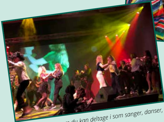
Skoleforestilling, som du kan deltage i som sanger, danser, musiker eller scenograf.