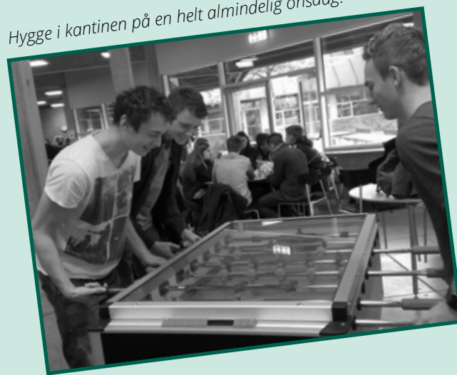
Hygge i kantinen på en helt almindelig onsdag.