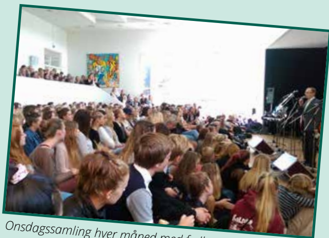
Onsdagssamling hver måned med fællessang, info og underholdning, som klasserne står for på skift.